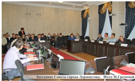
Заседание Совета города Лермонтова.

период 2019 и 2020 годов». Внесены изменения в решение Совета «Об утверждении Правил землепользования и застройки территории города Лермонтова Ставропольского края» от 28 июля 2010 года №51 и «О контрольно-счетной палате города Лермонтова» от 27 марта 2013 года №22. Согласовано внесение изменений в муниципальные программы, утверждена программа приватизации муниципального имущества на 2018 год.